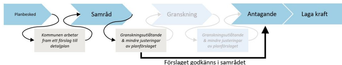
Figur 1. Planprocessen, begränsat standardförfarande.

Den aktuella detaljplanen upprättas med begränsat standardförfarande enligt plan- och bygglagen (2010:900) i dess lydelse efter 1 januari 2015. Detta då upphävandet inte bedöms innebära någon påverkan på allmänna intressen, inte medföra någon betydande miljöpåverkan samt att det inte strider mot gällande översiktsplan.