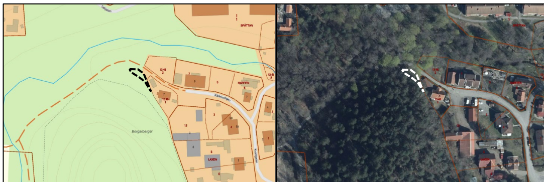
Figur x. Kartbilder som visar planområdet, det område där stadsplanen från 1958 fortfarande är gällande, och som föreslås upphävas.

Planområdet innefattar cirka 180 kvadratmeter av den kommunalt ägda fastigheten Kisa 12:1, se figur x. Det finns idag inga byggnader inom planområdet och det är i sin helhet planlagd som allmän plats.