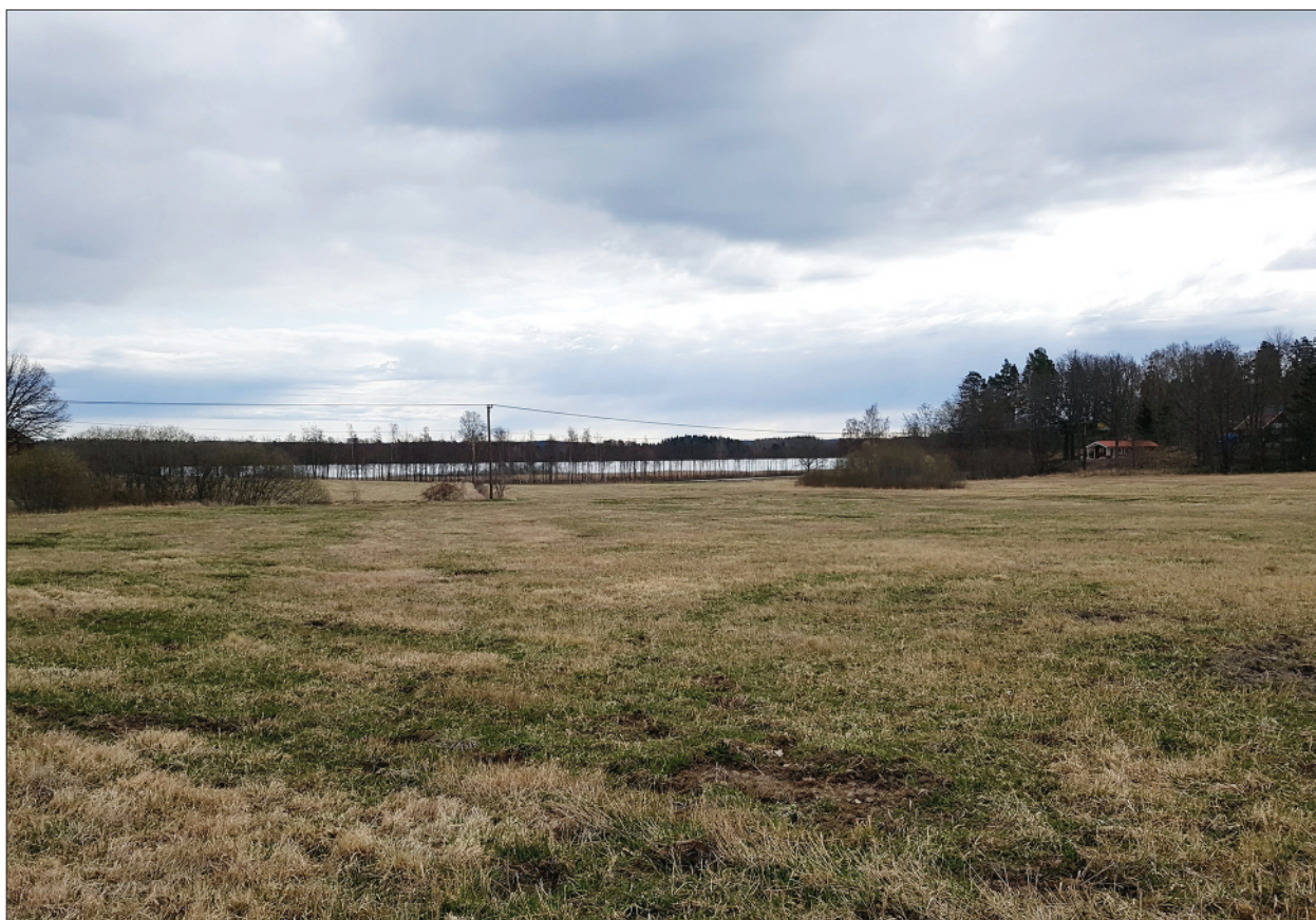
Figur 3. Översiktsbild över utredningsområdet med sjön Åsunden i bakgrunden. Foto mot sydöst, Anders Olofsson, ÖM.

återfinns oftast i dessa områden. Utifrån lösfynd av stenyxor tycks bosättning och uppodling av området ha inletts under den yngre delen av stenåldern. Inom Krågedals och det angränsade Håkantorps marker har merparten av lösfynden påträffats. En holkyxa samt en rombyxa funna vid Linnäs respektive Rimforsa indikerar möjlig kontinuitet under bronsålder (Hellman 1973:92ff). Ortnamnssammansättningen och ett relativt stort antal kvadratiska och runda stensättningar pekar mot en bebyggelseexpansion under den äldre järnåldern. Den yngre järnåldern finns representerad av ett antal gravfält, t ex L2009:7288 (RAÄ Tjärstad 60:1) och L2010:4307 (RAÄ Tjärstad 98:1). Sannolikt har även bygdens talrika fornborgar tillkommit under denna period. Från den närliggande sjön Striern belägen ca en halv mil österut har en borrhärd av bottensediment pollenanalyserats. Analysen pekar på att den första större uppodlingsfasen i området ägde rum under vikingatiden (Öster 1973:55f). Även en del av bebyggelsenamnen med ändelsen –torp kan ha etablerats under slutet av yngre järnåldern, men kan även ha tillkommit betydligt senare. Fram till 1992 var endast en förmodad förhistorisk boplats känd inom socknen, L2010:4883 (RAÄ 95:1), men sedan dess har boplatsindikationer framkommit vid arkeologiska undersökningar i bland