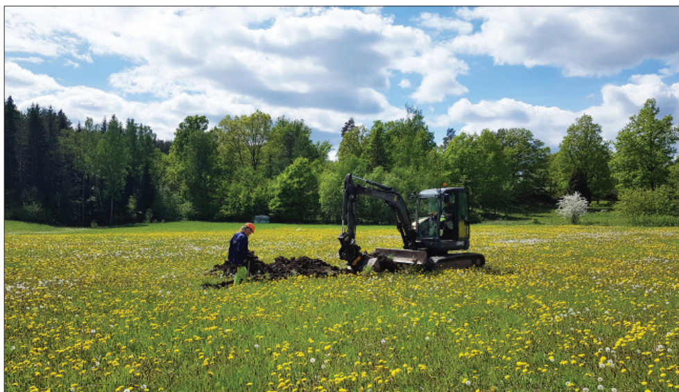
Figur 5. Arbetsbild, Roger Lundgren sökschaktar. Foto mot väster, Anders Olofsson, ÖM.

högre delarna av utredningsområdet kunna ha nyttjats vid förhistoriska aktiviteter även om topografin i så fall pekar mer mot boplatslämningar än gravar och stensättningar. Även om de lägre delarna en gång utgjort sjöbotten så torde de nog under förhistorisk tid mer liknas vid sjöäng/våtmark. Fornlämningspotentialen på denna del av utredningsområdet bedöms därför som låg. Sökschaktningen i samband med utredningens etapp 2 begränsades därför till att omfatta de högre liggande delarna av utredningsområdet.